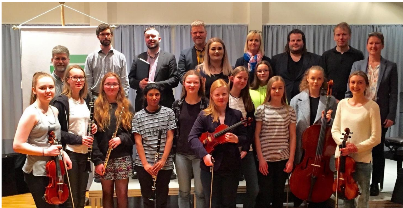
Nemendur og kennarar á miðeildartónleikum í mars